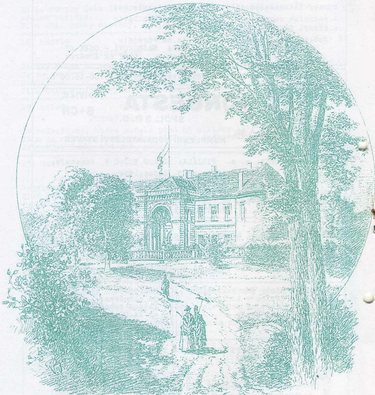
Vchod do zámku Zbirožského.