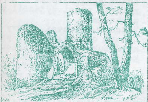
Valdek ze strany jihovýchodní.

krátkém odpočinku a opečení vuřtů se pokračovalo v cestě na hrad Valdek. Byla provedena prohlídka hradu, který byl vybudován šlechtickým rodem Zajíců nejpozději v 50. letech 13. století. Z původního rozlehlého hradu jsou dnes dochovány jenom zříceniny s výjimkou mohutné věže, stěny paláce a několika vedlejších budov a zbytky hraděbního zdiva.